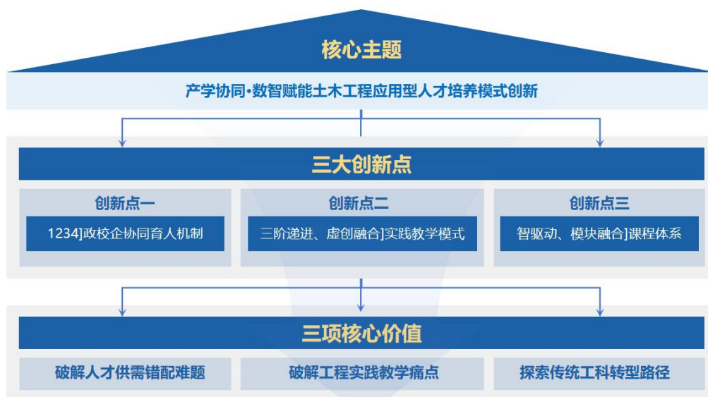
图 4.1 教学成果创新体系