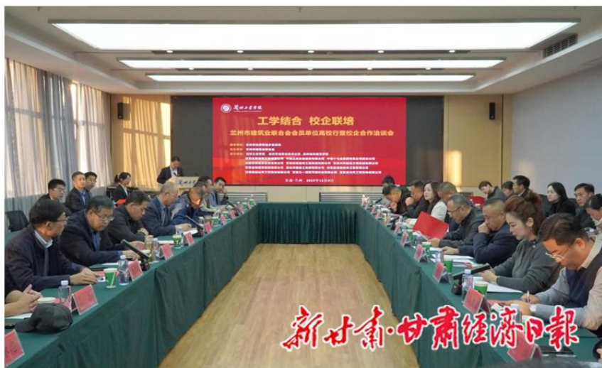
图 5.2 组织全省校企协同产教融合会议

联合甘肃建投集团、北京广联达科技公司等6家单位成立智能建造产业学院理事会，将“三阶递进”实践教学模式推广至企业员工培训，累计为合作企业培养BIM技术员、智能施工管理员等技术骨干420人次。依托甘肃省绿色与智能建造行业技术中心，为甘肃建投、兰州新区建设集团等10余家企业提供技术咨询服务，解决黑水峡淹没区明长城数字勘察、积石山地震灾区校舍排查等技术难题6项，支撑“一带一路”沿线基础设施建设项目5项，承担教育部产教融合项目、甘肃省产业支撑项目、甘肃省重大研发项目等教学改革与科研项目40余项，组织召开全省产教融合会议、全省职业技能考评会等行业学术活动多次。