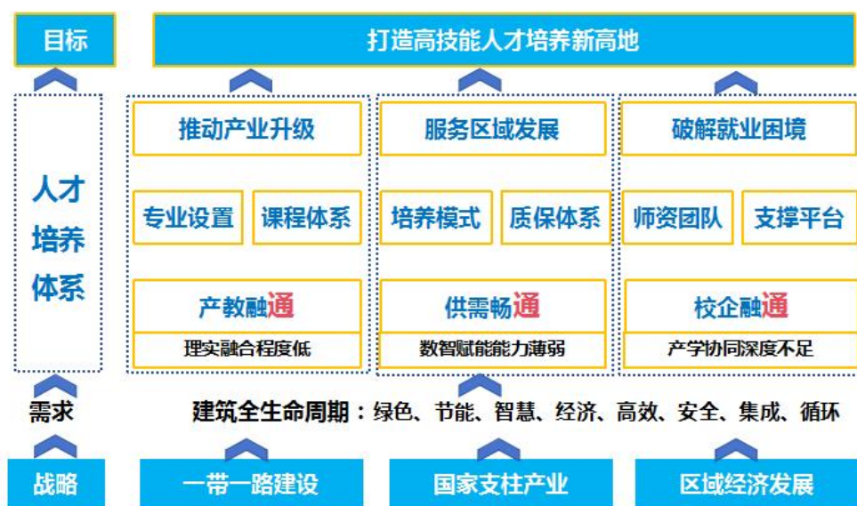
图 2.1 教学成果构建与应用框架图

以 OBE 理念为指导，紧扣行业“数智化、绿色化、复合型”人才需求，通过“政校企协同、理虚实融合、教研赛贯通”三维改革路径，破解传统人才培养模式的三大痛点，构建适应地方产业发展的土木工程应用型人才培养体系。