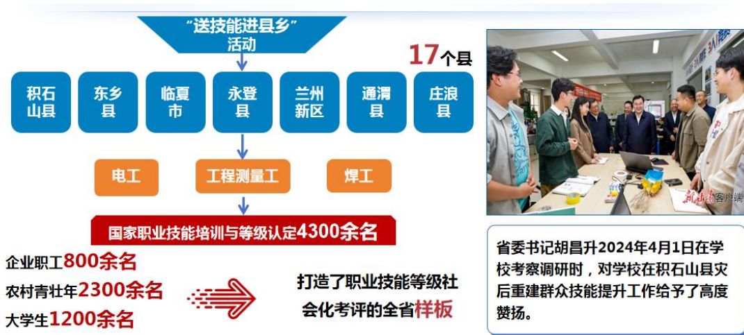
图 5.3 主动服务区域经济社会发展

校企共受益： 合作企业、高校共同参与人才培养，提前储备优质人才。高校利用人才、技术优势，送技术进乡村、进企业，先后培训企业职工800余人，农村青壮年2300多名，有效发挥了高校人才培养、服务区域经济社会发展的社会责任，相关工作得到省委领导首肯。