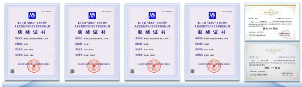
图 5.1 助力大学生成长成才

学生能力大幅提升： 团队重视学生实践能力的培养与提高，打造“以赛促学、以赛促教”的办学特色，积极组织学生参加各级各类技能竞赛，近三年获省级以上工程实践类竞赛奖项 200 余项、创新创业奖项 37 项，完成企业横向课题 18 项，孵化学生创业项目 5 个。同时，利用国家毕业生就业能力提升项目，推动“毕业证+技能证”的双证制度，开展工程测量工、建筑信息(BIM)建模员、SYB 创业等培训，毕业生平均持有 2~3 项职业技能证书。通过以上措施，有效提升了大学生的实践能力和就业能力。