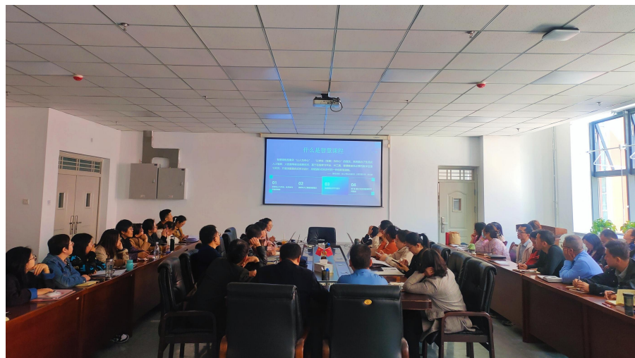
图 3.2 智慧课程建设培训

师资能力提升： 多途径推动实施“教师数智能力提升计划”，着力提升教师数智化教学水平，让课堂活起来，让学生动起来。12名教师获全国BIM技能讲师认证，35位教师获“双师双能型”资格，支持专业教师到企业参与真实项目，为教学改革提供坚实师资支撑。